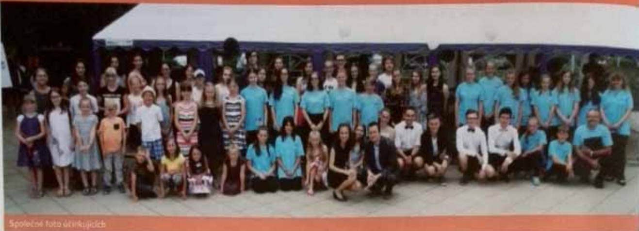
Společné foto účastníků