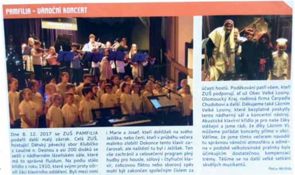
Dne 8. 12. 2017 se ZUŠ PAMFILIA podařil další malý zázrak. Celá ZUŠ, hostující Dětský pěvecký sbor Klubíčko z Loučné n. Desnou a asi 200 diváků se sešli v nádherném lázeňském sále, které má to správné fluidum. Na pódiu stálo křídlo z roku 1910, které svými prsty oživilo žáci klavírního oddělení. Byli mezi nimi

Dne 8. 12. 2017 se ZUŠ PAMFILIA podařil další malý zázrak. Celá ZUŠ, hostující sbor Klubíčko z Loučné n. Desnou a asi 200 diváků se sešli v nádherném lázeňském sále, které má to správné fluidum. Na pódiu stálo křídlo z roku 1910, které svými prsty oživilo žáci klavírního oddělení. Mezi některými z nich byla i Marie a Josef, kteří dohlíželi na svého Ježíška, nebo čerti, kteří v průběhu večera malinko zlobili! Dokonce tento klavír začarovali, ale naštěstí tu byl i Ježíšek. Ten vše zachránil a celovečerní program plný hudby pro housle, sólový i čtyřruční klavír, zobcovou flétnu nebo sborový zpěv mohl být zakončen společným číslem v podání orchestru, sboru a hostů. Poděkování patří všem, kteří ZUŠ podporují, ať už Obec Velké Losiny, Olomoucký kraj, rodinná firma Čerpadla Chudobovi a další. Děkujeme také Lázním Velké Lo-