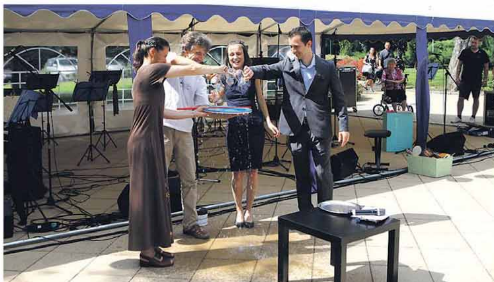
V podhůří Jeseníků zahájila činnost nová základní umělecká škola.

Při koncertu zazněly nejen známé filmové melodie v podání orchestru, ale také sóla všech studijních zaměření. Pro první školní rok byla otevřena studijní za-